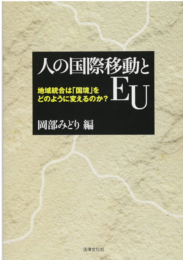
人の国際移動とEU: 地域統合は「国境」をどのように変えるのか?、法律文化社 (2016/4/15)