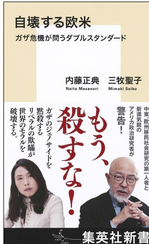
自壊する欧米 ガザ危機が問うダブルスタンダード、集英社 (2024/4/17)