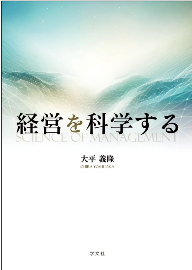
経営を科学する, 学文社 (2024/4/30)