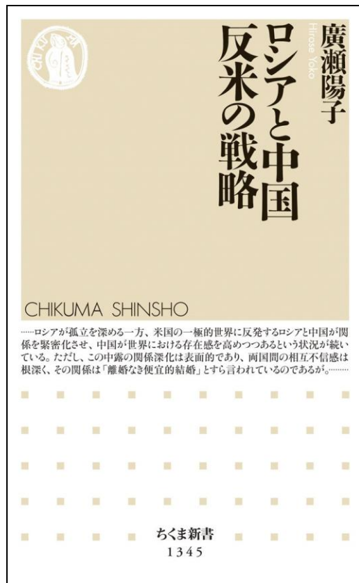
ロシアと中国 反米の戦略, 筑摩書房 (2018/7/6)