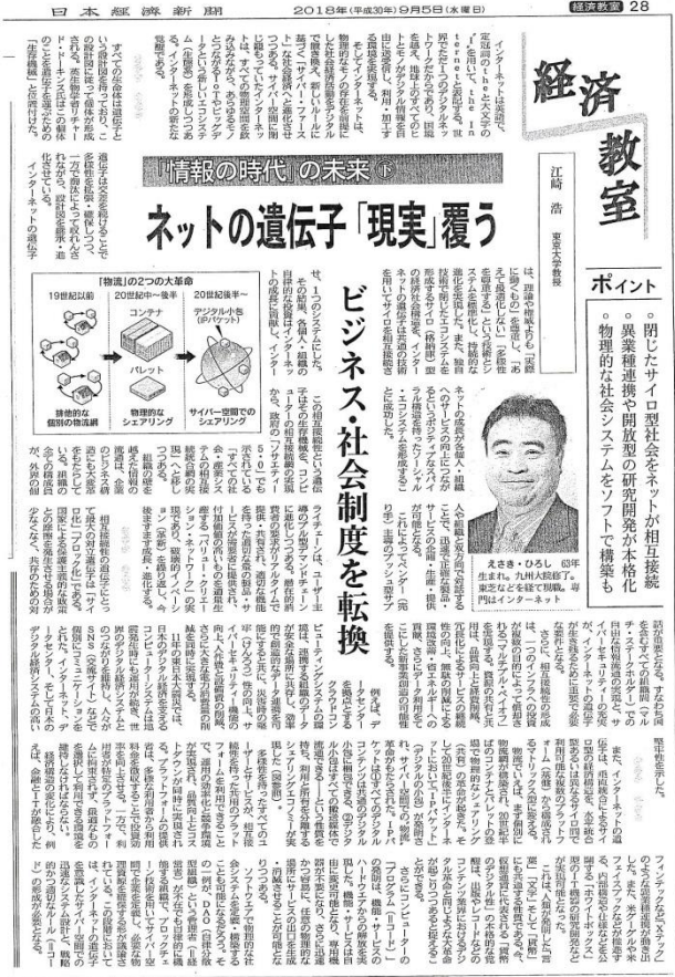
経済教室、「情報時代」の未来①, 日本経済新聞朝刊 (2018/9/5)