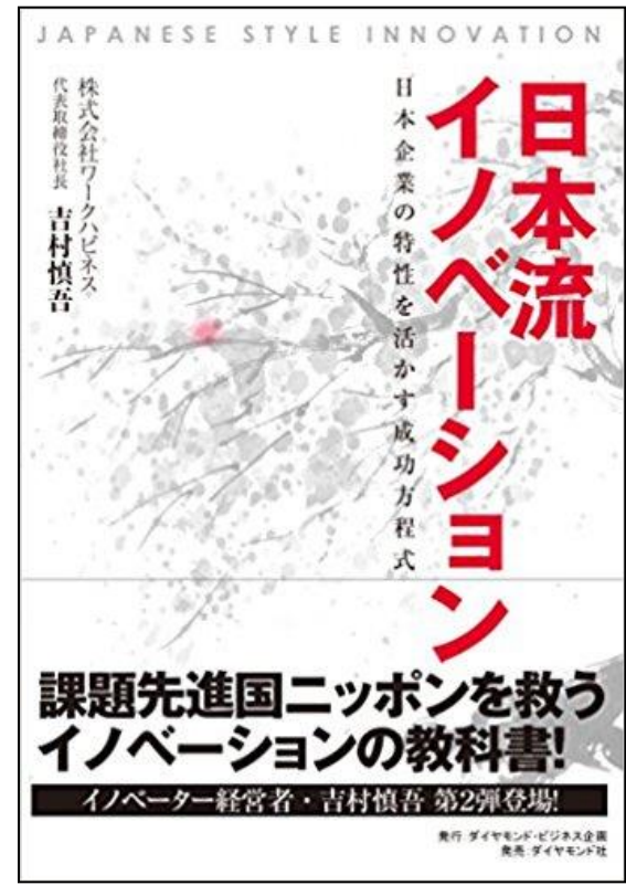
日本流イノベーション - 日本企業の特性を活かす成功方程式 ,ダイヤモンド社 (2017/1/20)