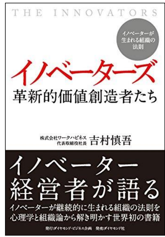
イノベーターズ 革新的価値創造者たち - イノベーターが生まれる組織の法則 ,ダイヤモンド社 (2014/7/26)

ホテルの20年続いた連続赤字を1年でV字回復、水耕栽培農業を活用した障がい者雇用支援サービスの立ち上げなど、数々のイノベーションを起こし、2006年2月に株式上場へと導く。